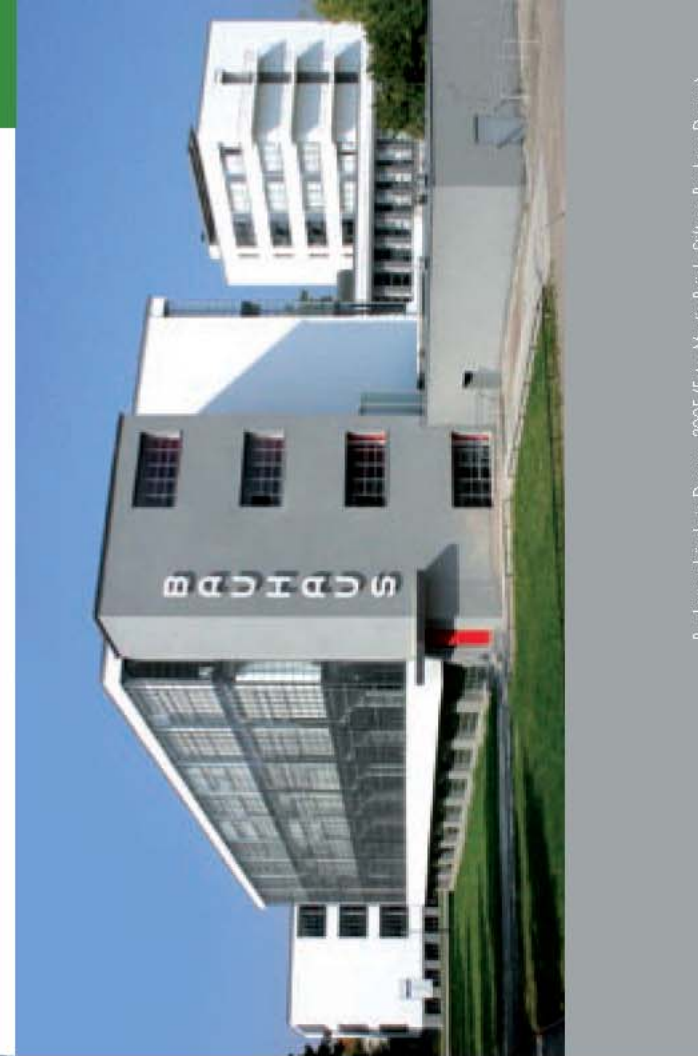
Bauhausegebäude in Dessau, 2005

DOCOMOMO Deutschland e.V. c/o Stiftung Bauhaus Dessau Monika Markgraf Gropiusallee 38 D – 06846 Dessau