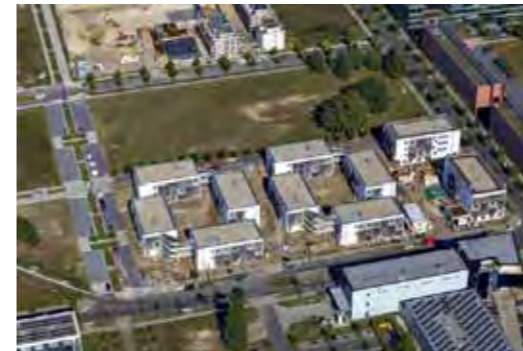
Studentendorf Adlershof im September 2014

Die versetzte Anordnung der Häuser öffnet die Anlage zur Straße. Je zwei Häuser teilen sich ein offenes Treppenhaus