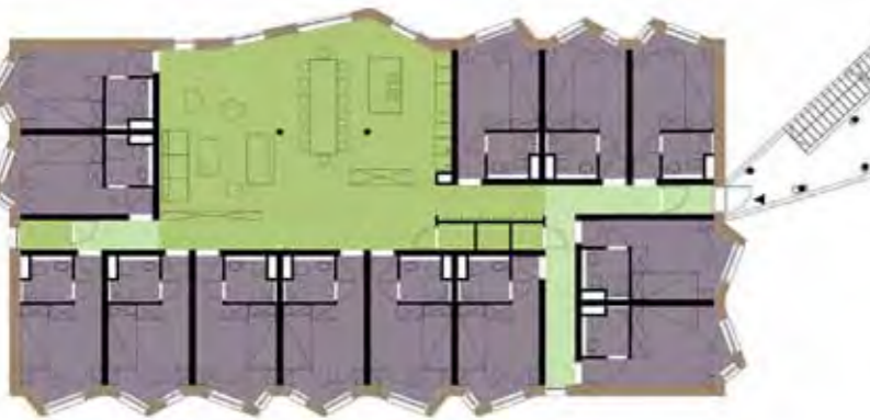
Obergeschoss Häuser 1–8