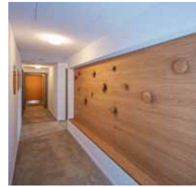
Die Garderobe (oben) und die großzügige Wohnküche in einer „Wohnlandschaft“. Jedem Haus ist eine Leitfarbe zugeordnet.

punkt im Westen machen jede weitergehende Beschäftigung so reizvoll. Es gibt wohl nur wenige Bauten, die so integer als „Wiederaufführung“ durchgehen. Unweigerlich wird man zu Vergleichen zwischen der gegenwärtigen Studentenschaft und derjenigen der bundesrepublikanischen Nachkriegsjahre verführt, die mit leichter und offener Architektur zu Austausch und demokratischem Handeln stimuliert werden sollte. Solche polit-pädagogischen Ansätze sind heute obsolet; nicht jedoch das immer wieder neu auszubalancierende Verhältnis zwischen Individuum und Gemeinschaft, zwischen Selbstbestimmung und Mehrheitsprinzip. Es braucht Orte, an denen solche Wohnereferenzen gemacht werden können. Mit der Neuinterpretation wird ein Weg aufgezeigt, wie man der Isolation entgegen kann, in die eine als pure Effizienz missverständene Moderne führen muss.