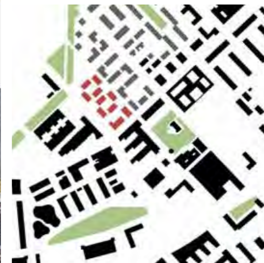
Lageplan im Maßstab 1:10.000

landeseigene Adlershof Projekt GmbH seit einigen Jahren nördlich des Hightech-Standorts das „Wohnen am Campus“; geplant sind rund ein-tausend Wohneinheiten.