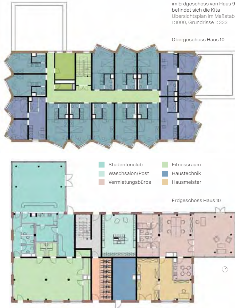
Blick auf den „Dorfplatz“ mit den Vermietungsbüros, im Erdgeschoss von Haus 9 befindet sich die Kita Übersichtsplan im Maßstab 1:1000, Grundrisse 1:333