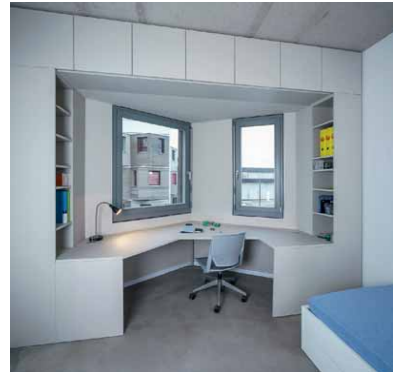
Blick in ein Apartment: der „Denker-Erker“, umrahmt von Regalen und Einbauschränken. Rechts: die zugehörige Pantry und der Korridor