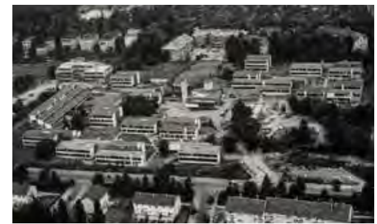
Studentendorf Schlachtensee, 1963

Die Mehrzahl der Wohnplätze ist in den übrigen acht Häusern als „Wohnlandschaft“ angelegt, bei der jeweils zehn bis dreizehn individuelle Räume um einen rund 100 Quadratmeter großen Gemeinschaftsraum gruppiert sind, in dem gekocht, gegessen und gesessen wird. Diese Wohnlandschaften sind ihrerseits alle zu einem grünen Hof ausgerichtet, so dass jeder sehen kann, was gerade in den anderen Häusern los ist. Im Vorfeld der Planung hatten sich Architekten und Bauherr das preisgekrönte Tietgen-Kolleg in Kopenhagen angesehen, eine kreisrunde Großform mit zentralem Gemeinschaftsgarten (Architekten Lundgaard & Tranberg, 2006). Die Idee des konzentrierten Freiraums ist in Adlershof noch als Spur vorhanden, aber durch das Umformen in Quader und das Aufteilen in zwei Bereiche deutlich abgeschwächt. Die Grünflächen