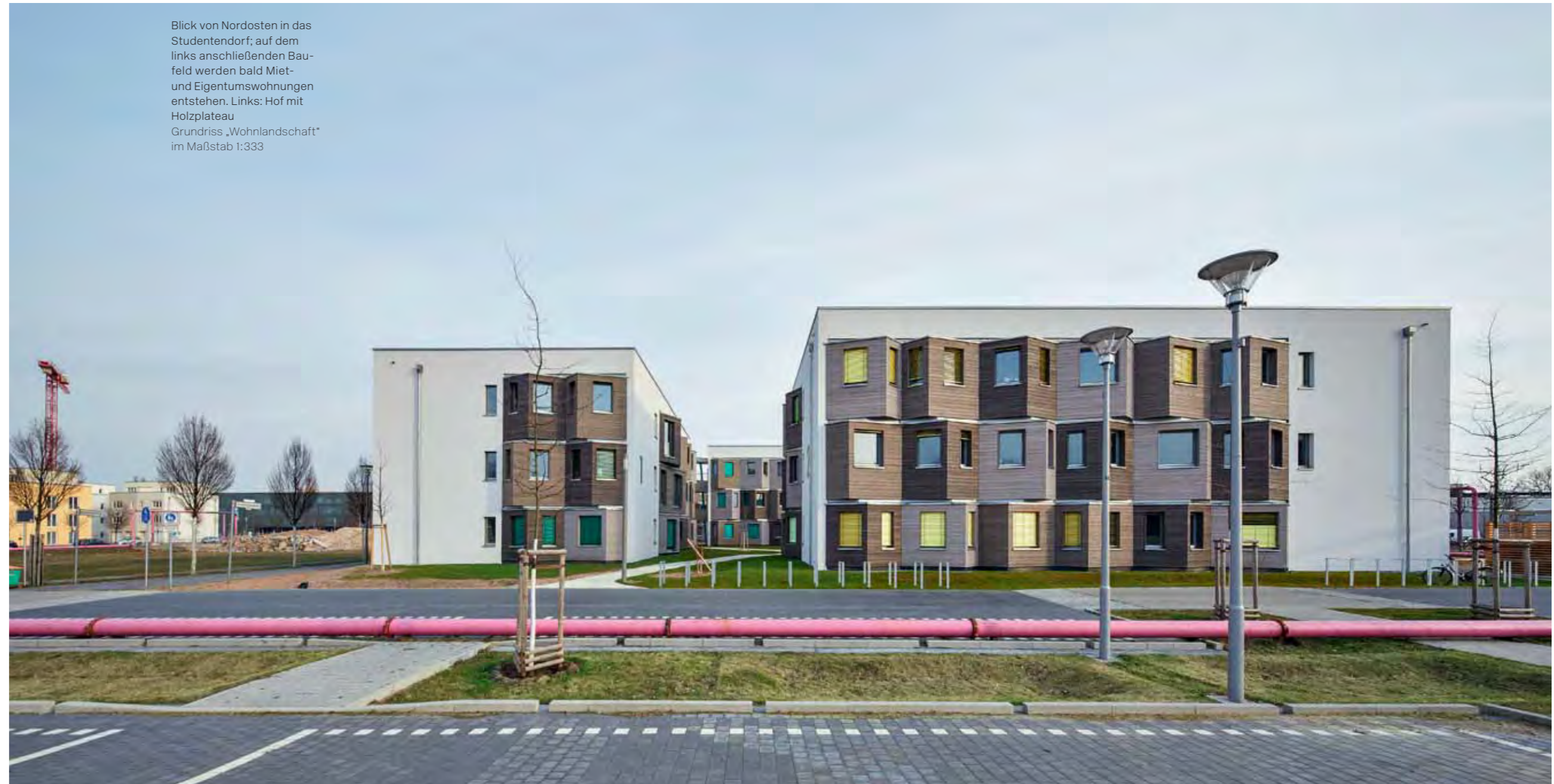
Blick von Nordosten in das Studentendorf; auf dem links anschließenden Bau-feld werden bald Miet- und Eigentumswohnungen entstehen. Links: Hof mit Holzplateau Grundriss „Wohnlandschaft“ im Maßstab 1:333