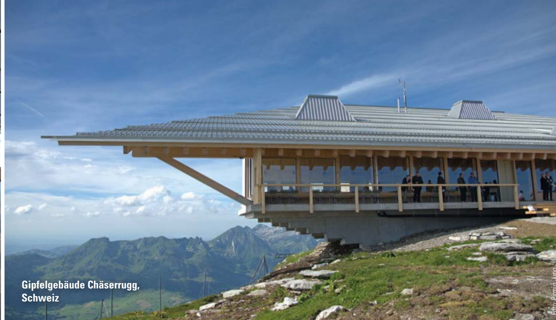
Gipfelgebäude Chäserrugg, Schweiz