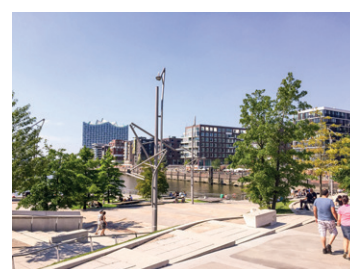
⑥ Marco Polo Terrassen