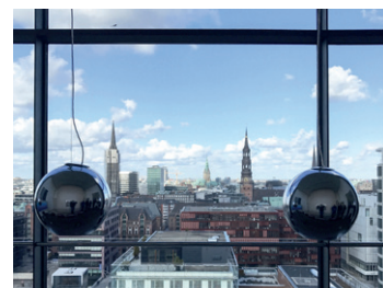
Ausblick Kirchtürme Rathaus